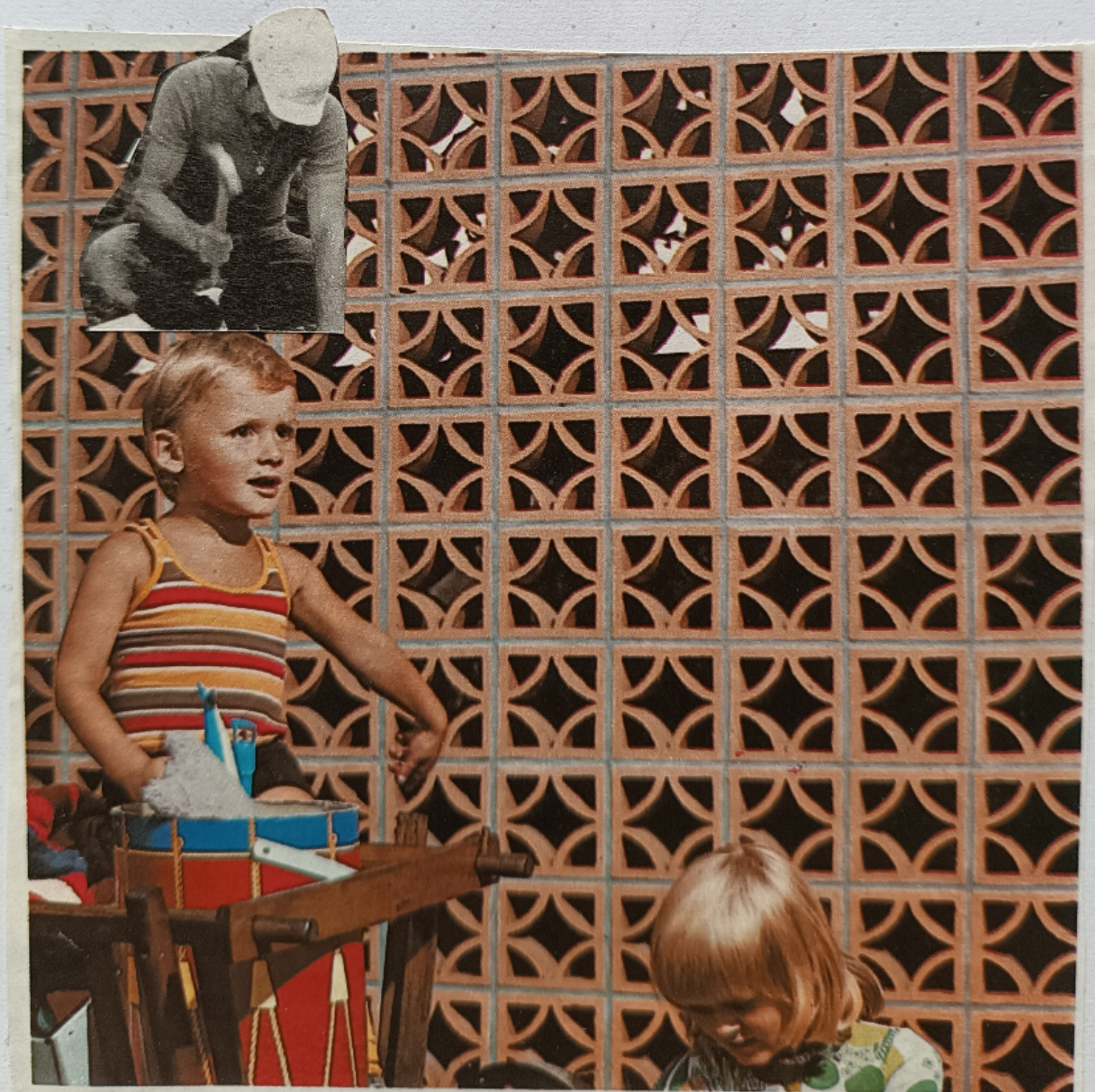
Les claustras, clôtures ajourées d'un effet singulier !